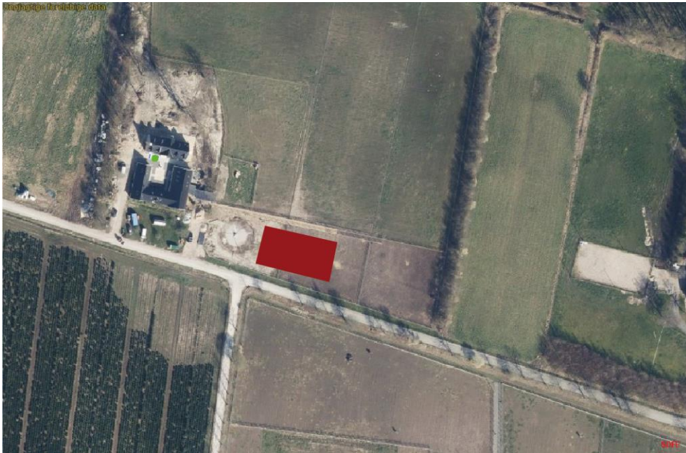
Figur 1. Luffoto marts 2020. Ridebanens placering er indtegnet med rødt.

hvorpå der lægges minimum 4 cm stenmel, derefter et ridelag bestående af ridebanesand og træflis. For at holde ridebunden på plads, vil der blive monteret et bræt i 20 cm højde rundt om banen. Den afgravede jord udlægges i ansøgers have.